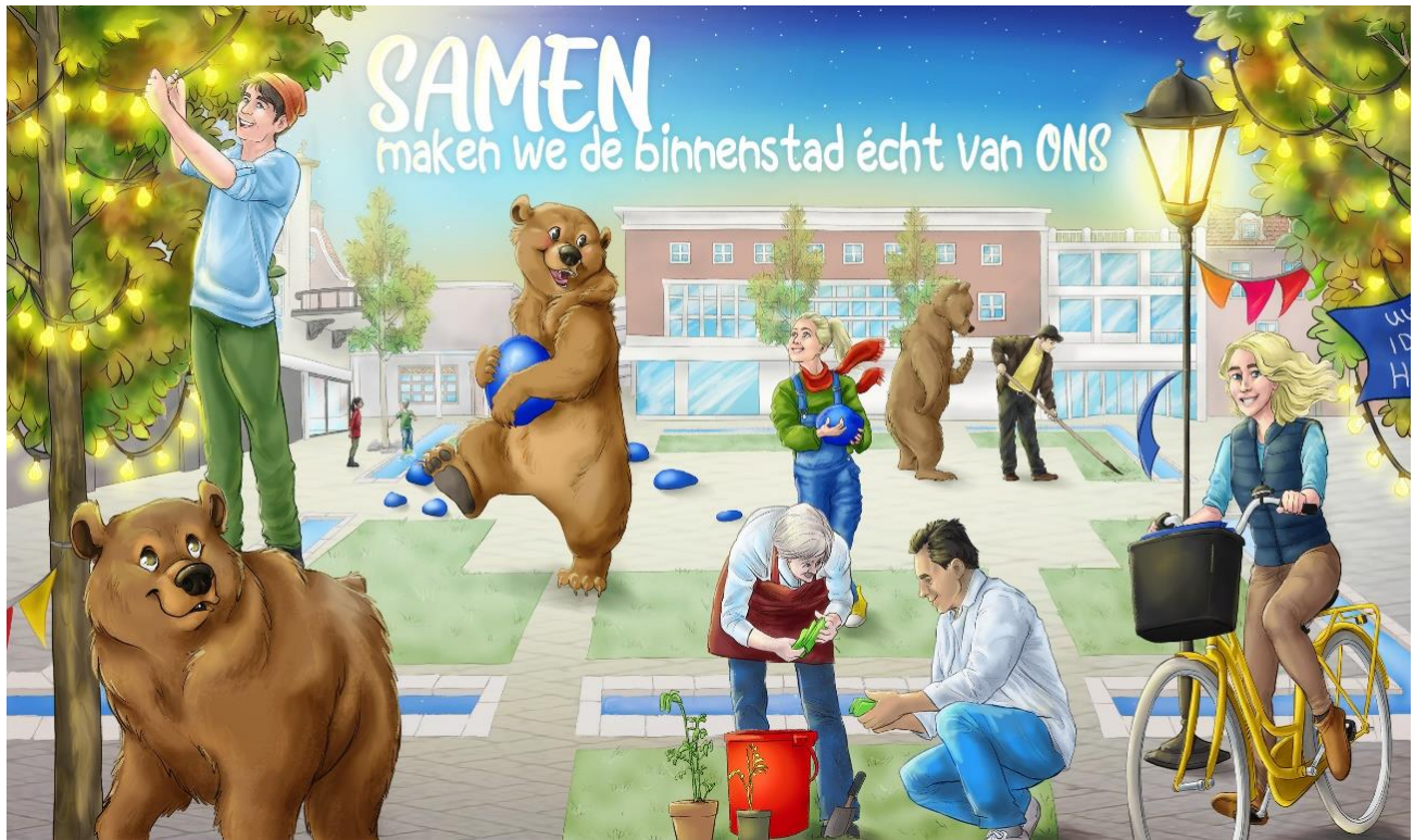
Tekening: Charlotte van der Veen